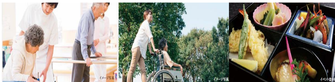
（個別リハビリ、外出支援や通院サポート、イベント食の各イメージ）

食事については、健康維持の観点から考えた栄養バランスはもちろん、季節食・行事食など、暮らしの楽しみになる食事を現地調理により提供します。管理栄養士が常駐し、ご入居者の体調に合わせた食事を提供します。