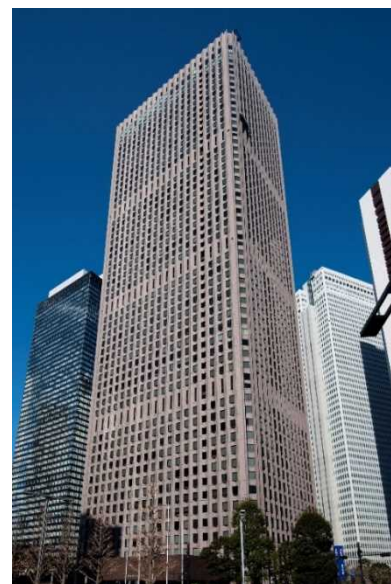
(新宿センタービル外観)