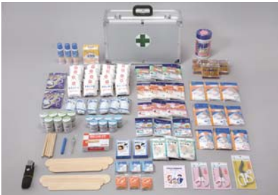
救急セット(参考写真)