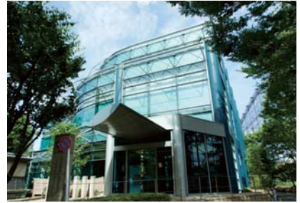
世田谷文学館／徒歩9分・約660m