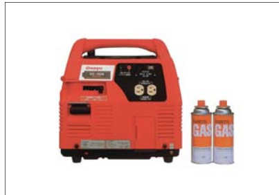
ガス発電機(参考写真)