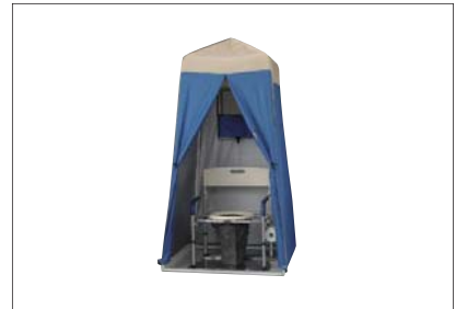
災害用マンホールトイレ(参考写真)