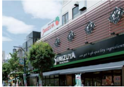
シミズヤ烏山店／徒歩12分・約930m