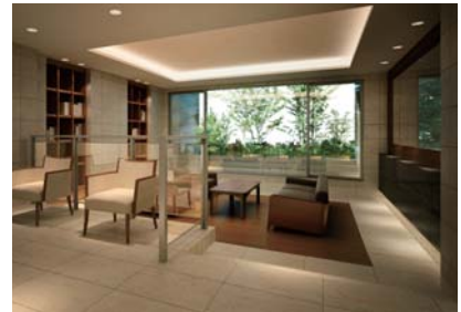
エントランスホール・ラウンジ完成予想CG