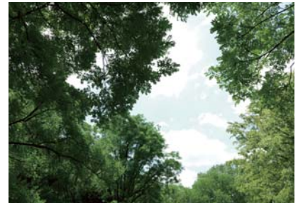
蘆花恒春園(芦花公園)／徒歩2分・約130m

徒歩2分にはこのエリアのシンボルともいえる「蘆花恒春園」。多くの名作を残した「徳富蘆花」が生活した旧宅や記念館のある「恒春園」と、その周辺の「児童公園」「花の丘」などがある「開放公園」からなりたち、武蔵野の面影が色濃く残る雑木林が、広大な緑地をつくりあげています。知的で文化的な薫りと、開放感にあふれる豊かな住環境と言えるでしょう。