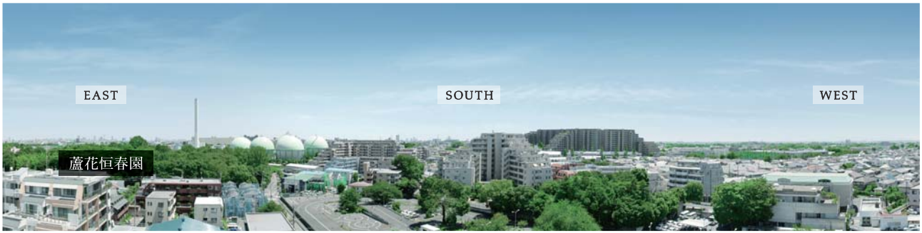
現地からの眺望写真