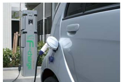
EV充電ステーション&カーシェアリング (参考写真)