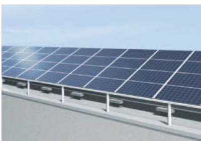
太陽光発電 (参考写真)