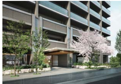
グランドエントランス完成予想CG