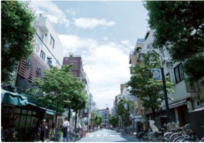
えるもーる烏山／徒歩9分・約680m

「千歳烏山」駅周辺には、大型スーパーやレストラン、さまざまなお店が揃う地元に着した商店街「えるもーる烏山」があり、その賑わいは世田谷区でも屈指と言われています。また、計画地周辺にも「サミットストア」などの商業施設や、フィットネスクラブなども充実し、暮らしやすい環境が整っています。