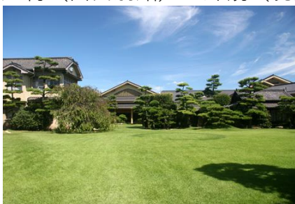
シンボルである芝生庭園