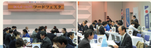
予約商談会の様子（「おいしさつながるフードフェスタin宇都宮」から）