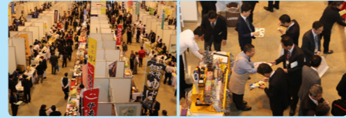
展示商談会の様子（「おいしさつながるフードフェスタin宇都宮」から）

「めぶき 食の商談会」は、地域の食関連業界のみなさまを幅広くお迎えし、たくさんの出会いの場を提供させていただきます。みなさまのご参加を心よりお待ちしております。