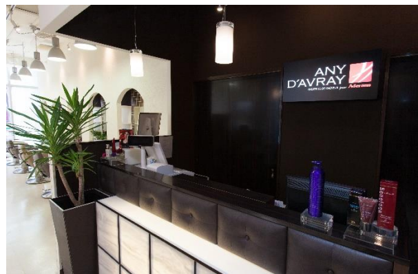
「アニーダブレイ福岡けやき通り」