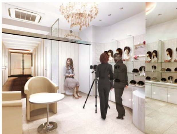
「アデランス天王寺あべのハルカス」（イメージ図）

アデランスでは、近年ウィッグをファッションとして楽しむ女性が増加しているのを背景に、さまざまな髪型をお楽しみいただける「スタイル・ミュージアム」の導入店舗を拡大しております。「アデランス天王寺あべのハルカス」の移転先は、2014 年 3 月に全面開業した、大阪の新たなランドマークとして注目を集める「あべのハルカス」の 28 階。明るい陽射しが差し込む心地よい店内からは阿倍野エリアが一望でき、極上の空間と上質のおもてなしにてお客様をお迎えいたします。