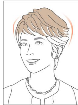
ベースの形が自由に変えられ頭にフィットします

ウィッグのベース部には、フラワーキャッチと呼ばれる、ベースの形が自由に変えられるループ状の部材を採用しており、様々な頭の形に快適にフィットします。また、フラワーキャッチ部には、毛が色々な方向を向くように植えてあり、ベースの間から自髪を引き出し馴染ませることで、より自然なヘアスタイルを実現します。