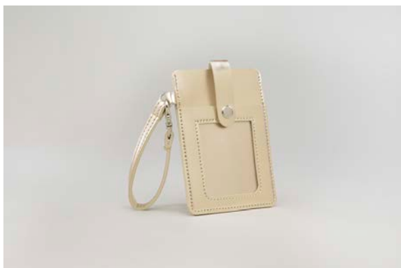
ご試着プレゼント 「オリジナル パスケース」

5 万円（税抜）以上ご購入上げのお客様に「FONTAINE×ROOTOTE オリジナル 巾着トート」をプレゼントします。トートバッグの専門ブランド「ルートート」のフォンテーヌ オリジナルバッグです。（なくなり次第終了）