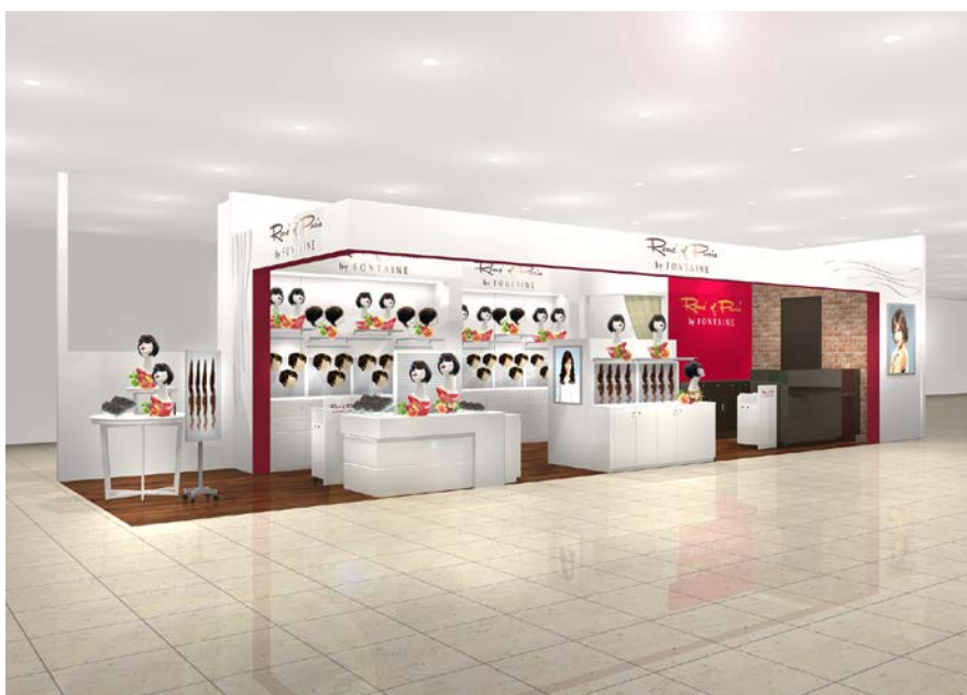
「ルネ オブ パリス by フォンテーヌ 福井エルパ店」 (イメージ図)

今回店舗を出店する「ラブリーパートナーエルパ」は、地域とのふれあいを大切にする福井県最大級のショッピングモールです。ファッション、グルメ、生活雑貨など多彩なフロア構成で、地域の生活拠点として多くの人々が訪れます。同店舗は、このような恵まれた立地条件を活かしながら、日々のコーディネートにプラスするだけで簡単にお洒落を楽しめるウィッグの魅力をお伝えしていきます。