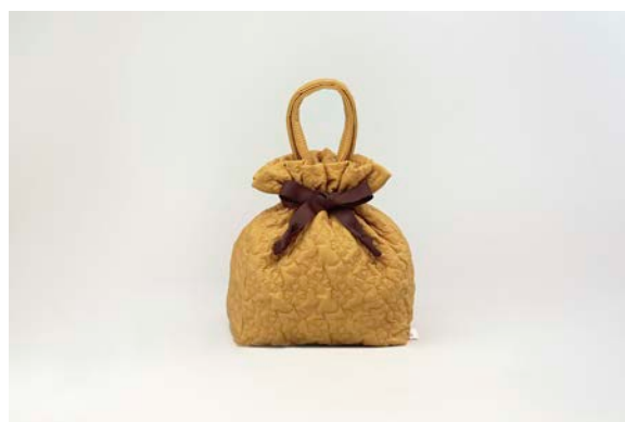
ご購入上げプレゼント 「オリジナル 巾着トート」