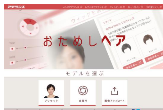
「おためしヘア」 （女性用）