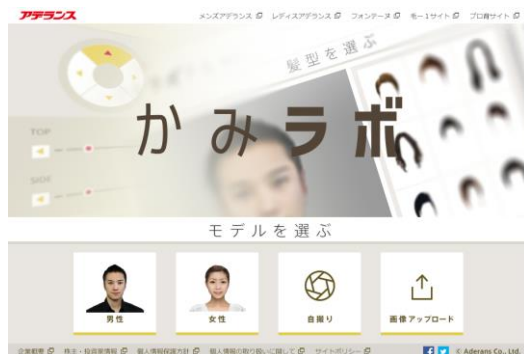
「かみラボ」 （男女兼用）

「ヘア TRY」ではパソコンからの利用に限られていたのが、「かみラボ」と「おためしヘア」ではスマートフォンとタブレットでも利用できるようになりました。パソコン用カメラやスマートデバイスで自撮りをして、すぐに仮想体験いただけます。また、完成した画像は、保存することができます。