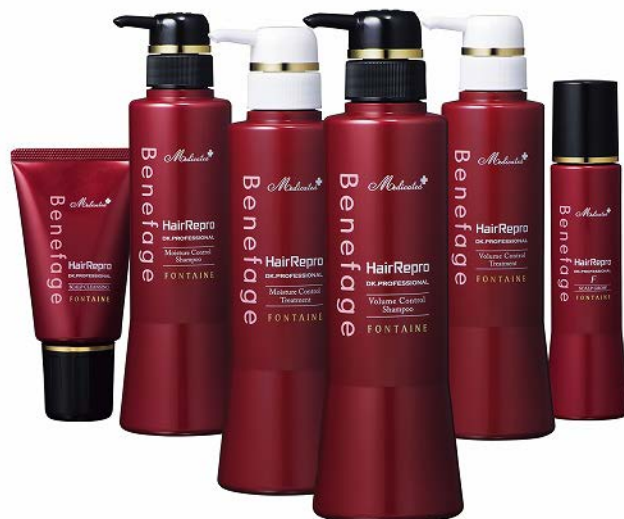
リニューアル新発売『Benefage HairRepro』シリーズ 写真は、リテール用（全6アイテム）

※ 1 小売業者向けの商品 ※ 2 アデランスのサロン向けの商品 ※ 3 頭皮（とうひ）＝スカルプより、スカルプの日 ※ 4 シリコン、着色料、香料、パラベン、サルフェート、鉱物油、フェノキシエタノールを使用しない7つのフリー