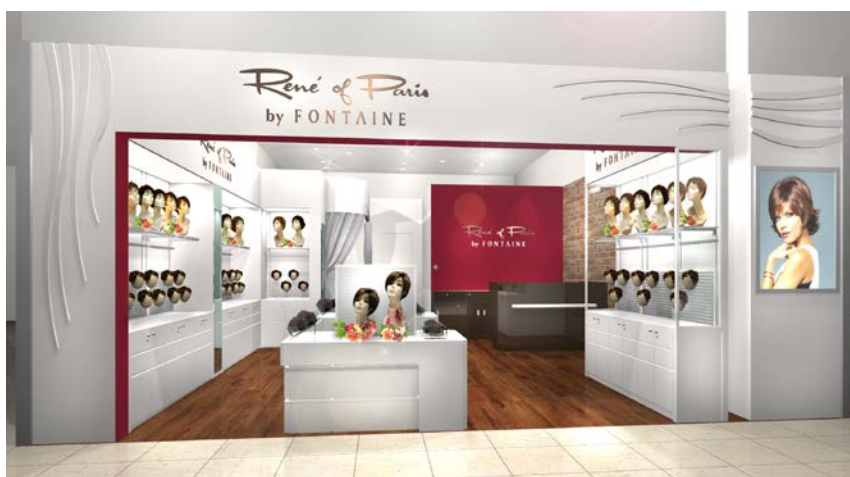
「ルネ オブ パリス by フォンテーヌ ビブレーションレイクタウン」 (イメージ図)

今回店舗を出店する「イオンレイクタウン kaze」2F ビブレーションは、エステティックサロンやネイルサロン、化粧品店のような、女性向けのサービス店が立ち並ぶ、女性買い物の合間に立ち寄りやすいフロアです。同店舗は、このような恵まれた立地条件を活かしながら、日々のコーディネートにプラスするだけで簡単にお洒落を楽しめるウィッグの魅力をお伝えしていきます。