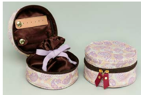
ご購入上げプレゼント 「オリジナル ジュエリーポーチ」