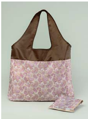
ご試着プレゼント 「オリジナル エコバック」

3万円（税抜）以上ご購入上げのお客様に「オリジナル ジュエリーポーチ」をプレゼントします。（なくなり次第終了）