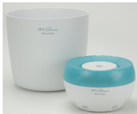
『Beaustage SPA Premium』