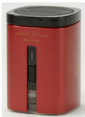
『Beaustage CHARGE Premium』

毛髪と皮膚とは関連性が強いことから、当社では長年、大学やパートナー企業との共同研究などを通じ、スキンケア、スカルプケア、ボディケア、ヘルスケアにも着目してまいりました。この度、美の専門チームを結成し専門家のアドバイスを頂きながら、エイジングケア分野に本格参入してまいります。