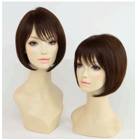
ショートボブ 左から Rafra Main (オン)、 Rafra Ex (オフ) 共にライトブラン系