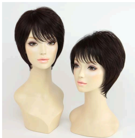
ショート 左から Rafra Main (オン)、 Rafra Ex (オフ) 共にブラウン系