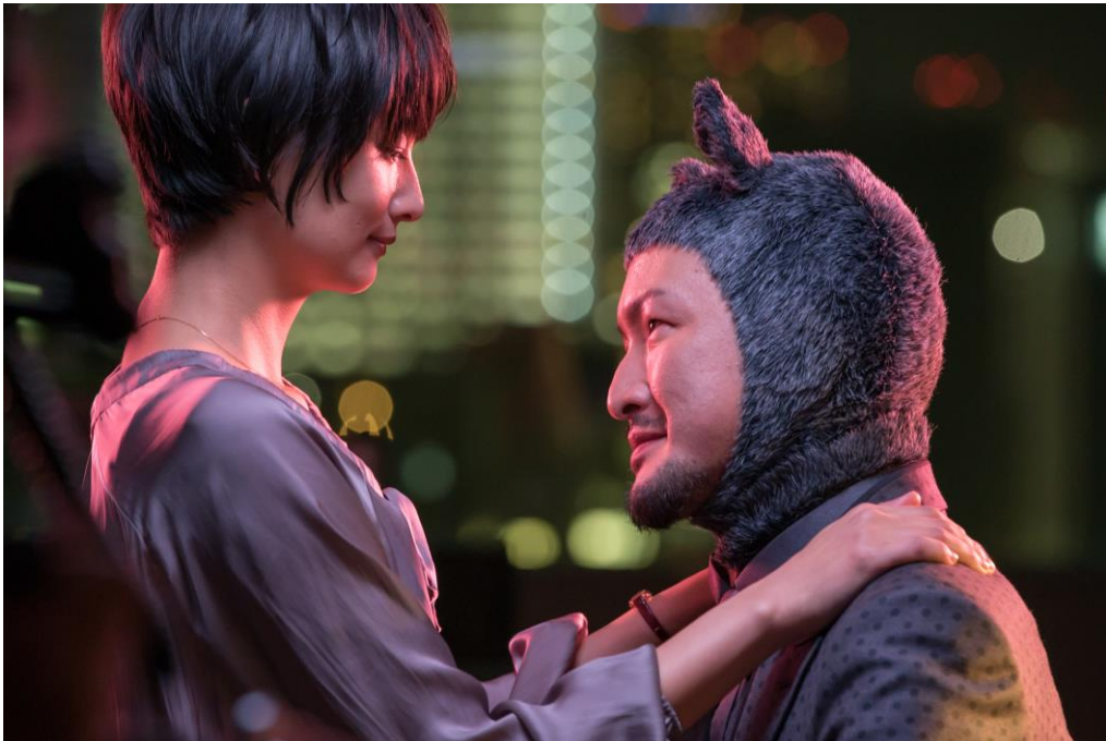
マウスコンピューター 新 TV-CM 「マウスと人と。ある OL の場合」篇