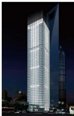
施設名称：21世紀ビル 所在地：上海市 高さ：236 m