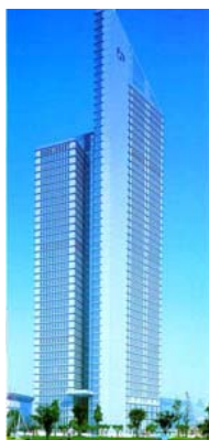
施設名称：交銀金融ビル 所在地：上海市 高さ：265 m