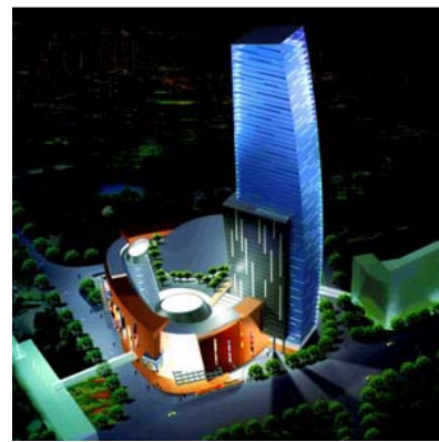
施設名称：長峰商城 所在地：上海市 高さ：242 m