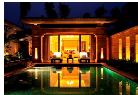
コンラッド三亜海棠湾

また、2011年5月には Hilton Hotels Corporation の五つ星ホテル「コンラッド三亜海棠湾」及び「ダブルツリー・バイ・ヒルトン三亜海棠湾」（ともに中国・海南島）と、婚礼部門における業務提携を開始いたしました。