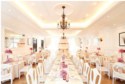
<ダイニングルーム>

都会に位置しながら屋上には緑豊かな天空ガーデンが広がっており、様々なアレンジを施したウェルカムパーティやフラワーシャワーなどの演出により、オリジナルな夢のウェディングが叶います。