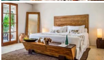
SANTA TERESA HOTEL RJ - BRAZIL