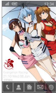
<エヴァンゲリオンレーシング>