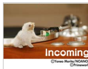
＜不在着信通知画面＞