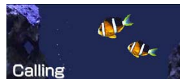
〈不在着信通知画面〉