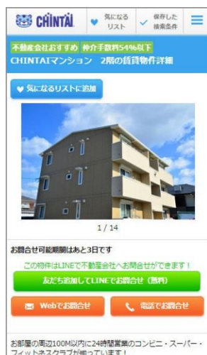
画像1:「CHINTAI」スマートフォンサイト 物件詳細画面