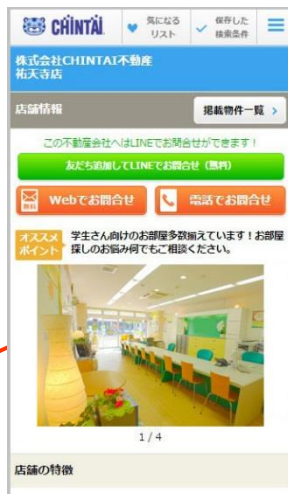
画像2:「CHINTAI」スマートフォンサイト 店舗詳細画面