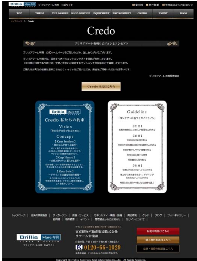
ビジョン・コンセプトの紹介

本日この資料は、以下の記者クラブに配布しています。 ・国土交通記者会 ・都庁記者クラブ