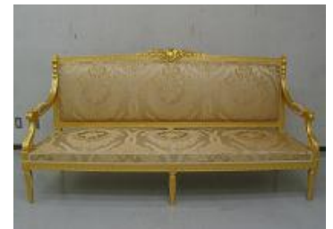
↑自社工場による家具製造の一例