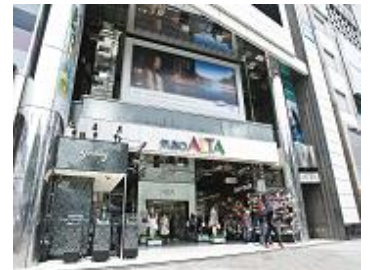
↑事業の一例：ヤングファッション特化タイプ（新宿アルタ）