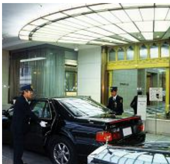
↑駐車場管理（イメージ）

施設環境の安全と快適を第一とした管理業務を行うとともに、施設における駐車場の運営・管理を行います。