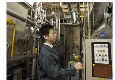
↑施設設備メンテナンス（イメージ）