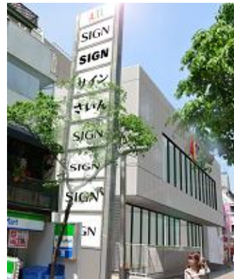
↑2015年春開店予定の原宿アルタ（イメージ）

商業施設、ホテル、オフィス、公共施設など、さまざまな施設空間のデザインから施工まで、インテリアに関わるハードを提案し、お納めします。