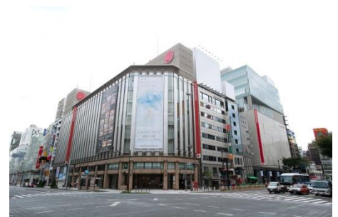
三越銀座店(東京都中央区)