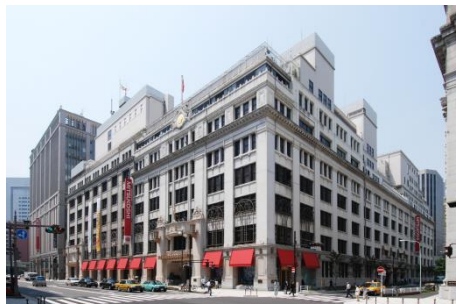
三越日本橋本店(東京都中央区)