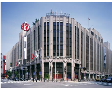
伊勢丹新宿本店(東京都新宿区)