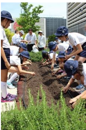
↑三越銀座店 銀座テラス全景

←地元の小学生の皆さんと落花生づくりなど、地域コミュニティとの共生の場にもなっています。