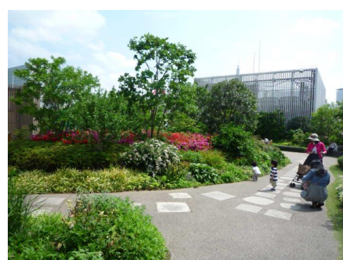
←季節の花が咲く中、 ご家族でゆっくり過ごして いただけます。

←地元の小学生の皆さんと落花生づくりなど、地域コミュニティとの共生の場にもなっています。