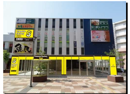
尼崎店 外観イメージ

住所 〒661-0976 兵庫県尼崎市潮江1-3-35 AMAGASAKI CROSSWALK 2F 電話番号 06-6495-2850 営業時間 10:00～20:00 アクセス JR尼崎線 北口徒歩5分