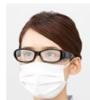
くもり止め加工なし