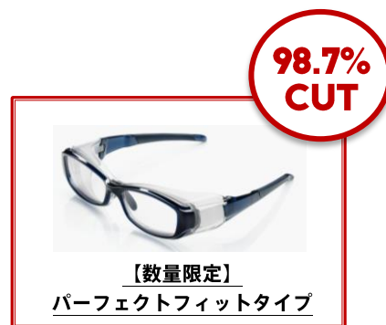
【数量限定】 パーフェクトフィットタイプ