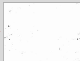
噴霧後の眼の表面

※実験方法：ワセリン塗布カバーガラスを JINS 花粉 CUT レンズ表面および眼の表面に固定した人頭模型をチャンバー内に設置。PM2.5と同等の大きさを持つ疑似PM2.5（ジルコニウム）を噴霧し、レンズ表面および眼の表面への付着量を顕微鏡を用いて計測しました。実験監修：深川和己先生（両国眼科クリニック） ※PM2.5の微細粒子のカット率は、顔の形などにより個人差があります。 ※本実験はパーフェクトフィットタイプによる結果です。