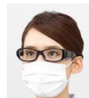
くもり止め加工あり

くもり止めレンズを標準搭載しているため、マスクと併用して使ってもレンズが曇りにくく、より快適にご使用いただけます。