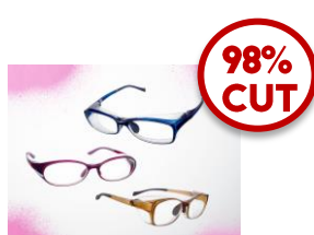
2014年～ スリムデザインタイプ