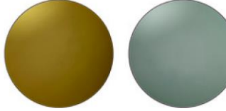
POLARIZING LENS ブラウン