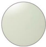
COLOR CONTROL クリアグレー