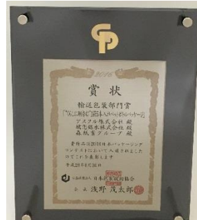
輸送包装部門賞 表彰盾