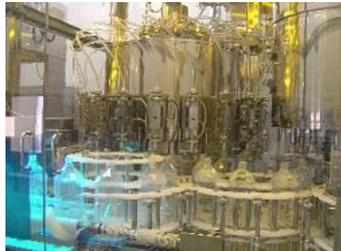
「自社成型ボトルの使用」と「非加熱無菌充填」によりおいしい水を製造