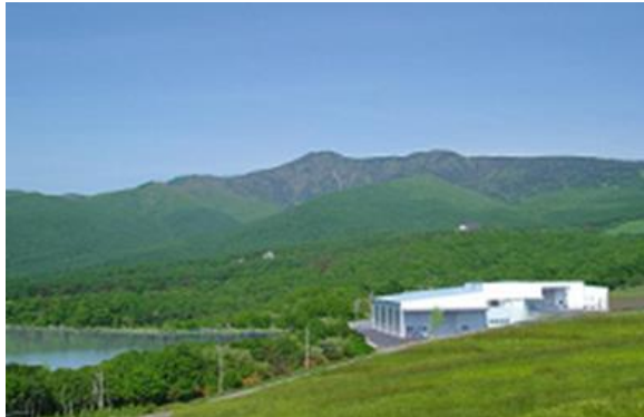
バラギ湖畔の豊富な湧水群に立つ工場

「LOHACO Water」の採水地は、2015年8月にアスクルグループ入りした孺恋銘水の所在地である群馬県吾妻郡孺恋村、日本百名山である四阿山(あずまやさん)の麓です。四阿山の雪融け水が伏流水となって地中深く浸透し、長年かけて安山岩のフィルターを通り地下250mから湧き出した天然水は硬度19の軟水。まろやかで飲みやすく、飲用はもちろんコーヒーやお茶出し、料理に使っても素材の味を引き出すおいしい天然水です。