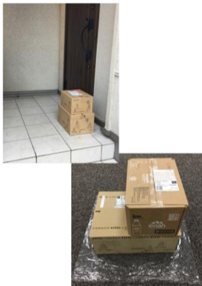
置き場所を指定して受け取る