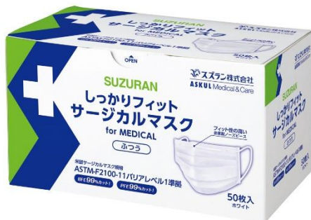
アスクル限定販売 スズラン「しっかりフィット サージカルマスク」ふつう/小さめ

<期間限定価格:9月15日午後6時から11月20日午後6時まで> 同サイズ 40箱以上ご注文時 1箱(50枚入) 218円 1枚あたり4.36円 <11月20日午後6時から2018年3月31日午後6時> 同サイズ 40箱以上ご注文時 1箱(50枚入) 238円 1枚あたり4.76円