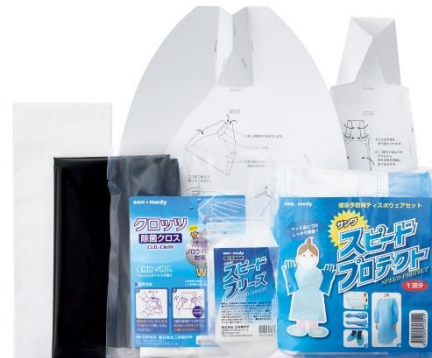
アスクル限定販売 三和製作所「看護師さんが選んだおう吐物処理キット」

<期間限定価格:9月15日午後6時から11月20日午後6時まで> 1箱(10セット入) 9,800円 1セットあたり 980円 <11月20日午後6時から2018年3月31日午後6時> 1箱(10セット入) 10,800円 1セットあたり 1,080円