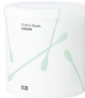
アスクル限定販売 サンリツ「抗菌綿棒」本体/詰替用

<本体> 1セット(6個入) 521円 1個(200本入)あたり 86.9円 <詰替用> 1セット(6個入) 509円 1個(200本入)あたり 84.9円