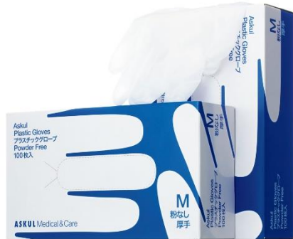
アスクルオリジナル 「プラスチックグローブ厚手 粉なし」 S/M/L

<期間限定価格:9月15日午後6時から11月20日午後6時まで> 同サイズ 40箱以上ご注文時 1箱(100枚入) 249円 1枚あたり2.49円 <11月20日午後6時から2018年3月31日午後6時> 同サイズ 40箱以上ご注文時 1箱(100枚入) 269円 1枚あたり2.69円