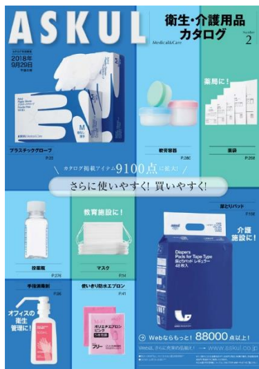
「衛生・介護用品カタログ 2017～2018 号」 (有効期限: 2018年9月29日午後6時)

アスクルは、介護施設や薬局のほか教育機関やオフィスの衛生管理でご利用いただける商品を掲載した「衛生・介護用品カタログ」を発刊しました。マスクやグローブ、ガーゼなどの衛生用品、おむつや介護食などの介護用品、薬局用品、白衣・シューズ、家具など約9,100アイテムを掲載しています。