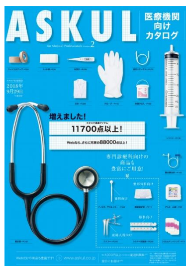
「医療機関向けカタログ 2017～2018 号」 （有効期限：2018年9月29日午後6時）

アスクルは、注射針などの注射・輸液や診察、処置用品などの医療材料に加え、白衣や医療用事務用品など約 11,700 アイテムを掲載し、医療機関の定番品をまとめてご購入いただける「医療機関向けカタログ」を発刊しました。※「医療機関向けカタログ」は、医療関連施設の確認が取れたお客様のみに配布しています。